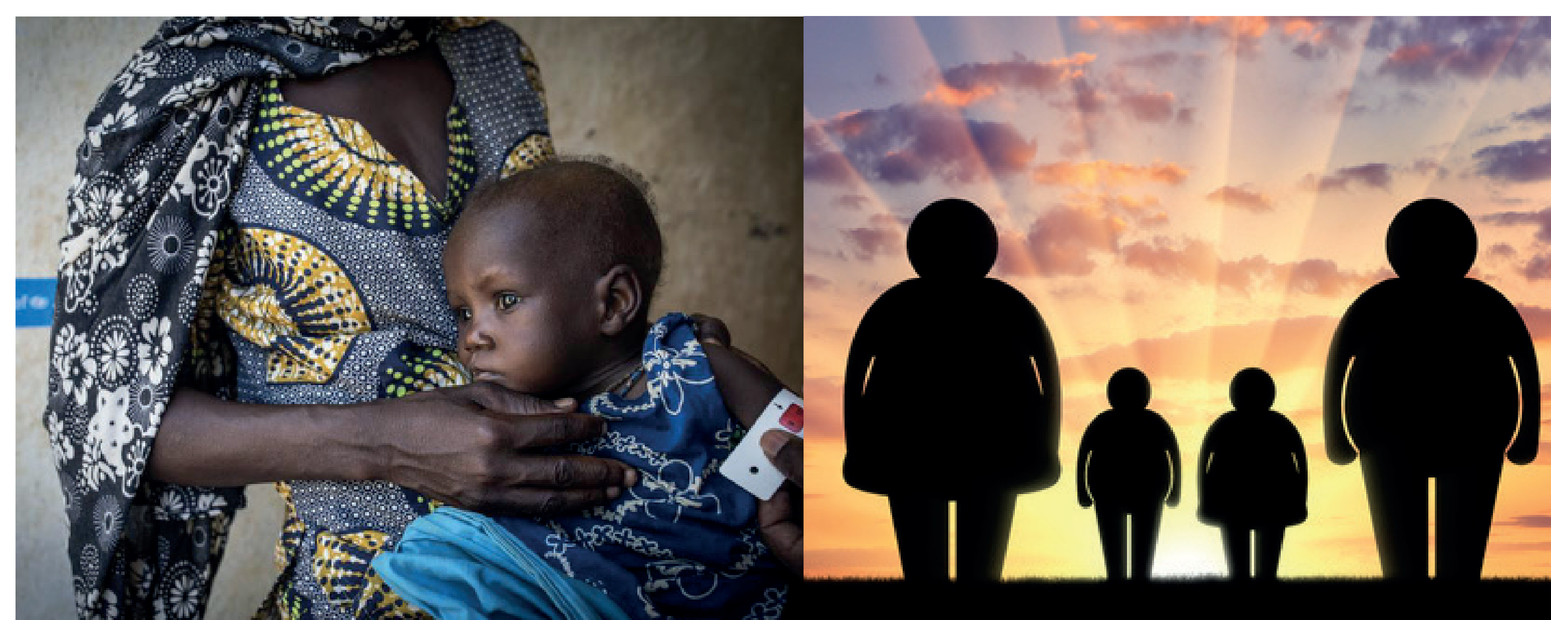
▲ Famille malnutrie